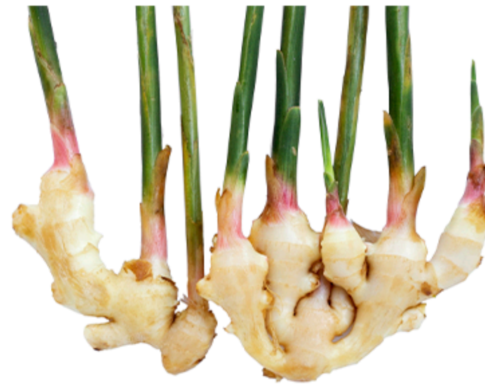
Baby ginger Gengibre novo