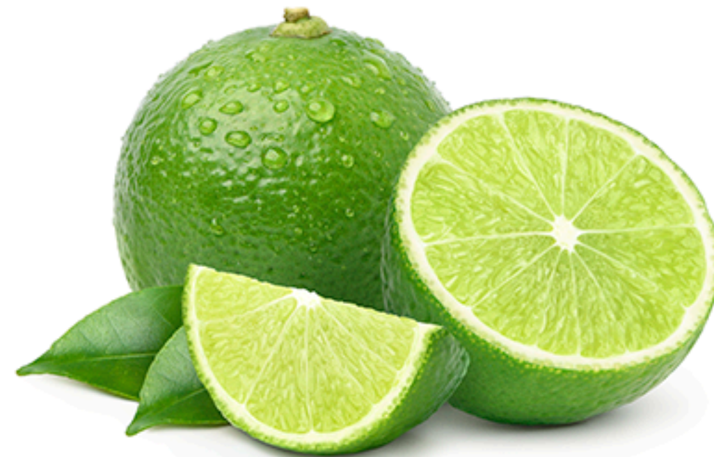
Tahiti Limes Limão Taiti