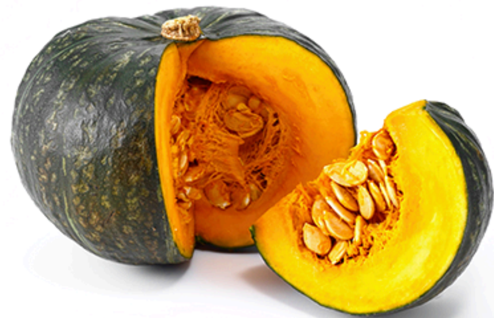
Kabocha pumpkin Abóbora kabocha