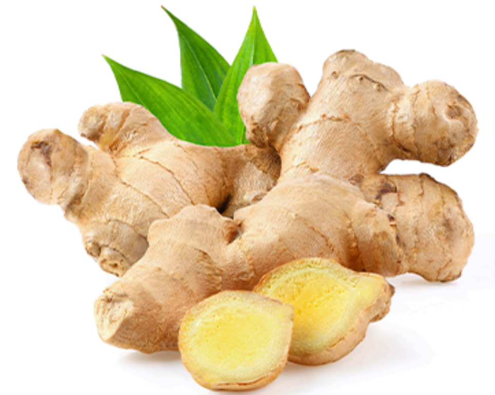
Fresh Ginger Gengibre fresco