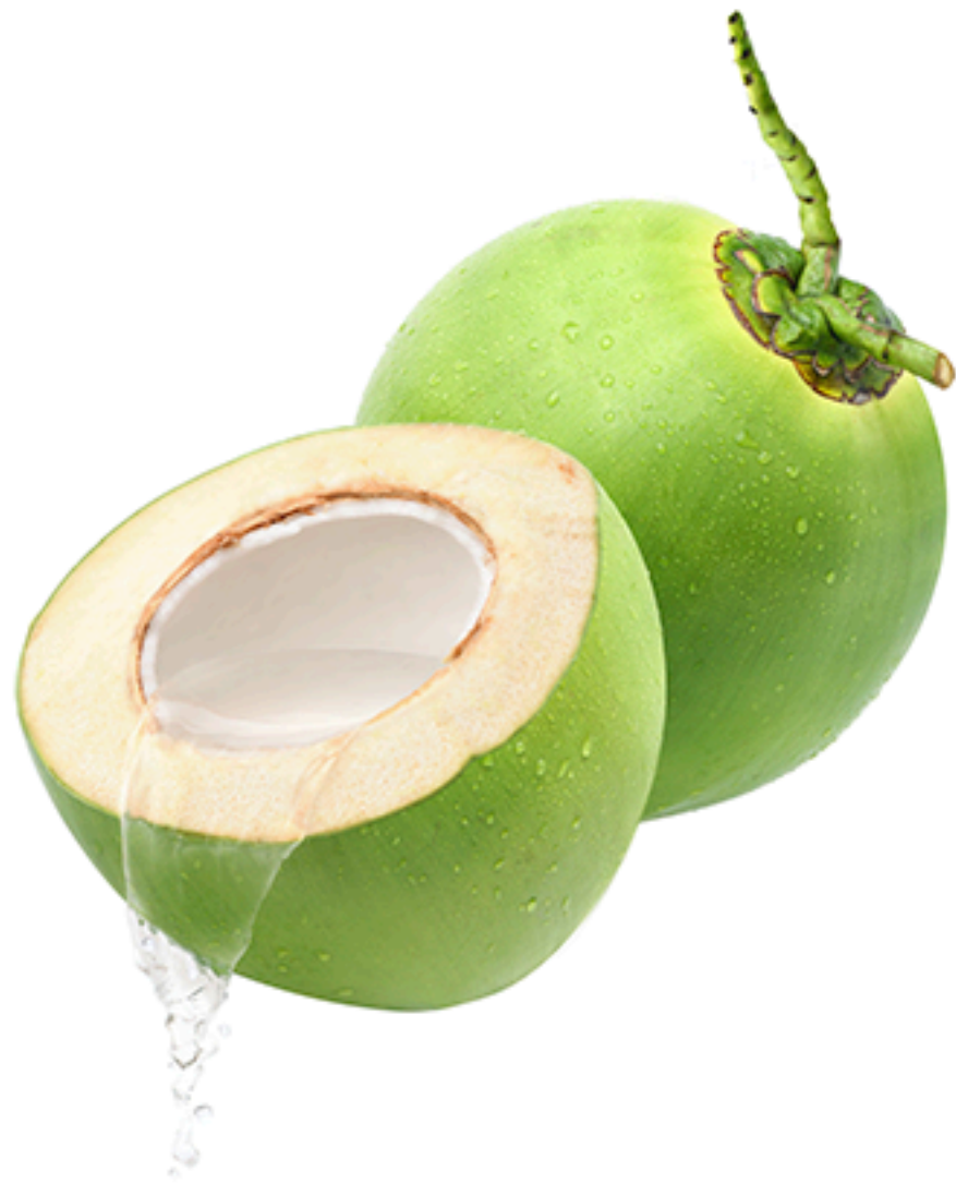
Green coconut Coco verde