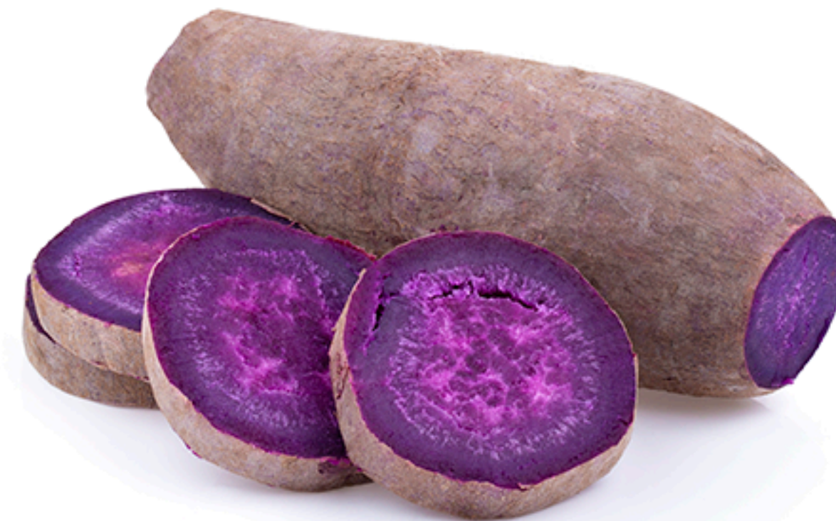
Purple Sweet Potato Batata doce roxa