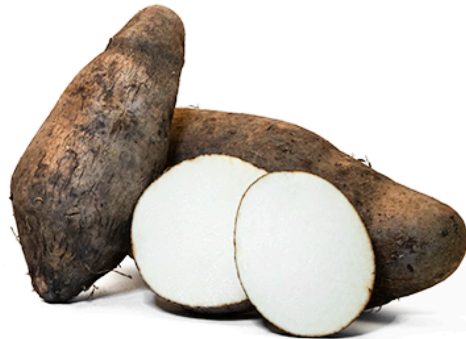
Cush-cush yam Cará doce