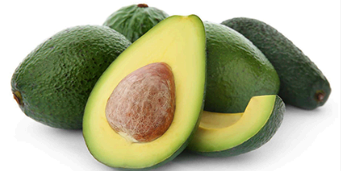
Tropical avocado Abacate tropical